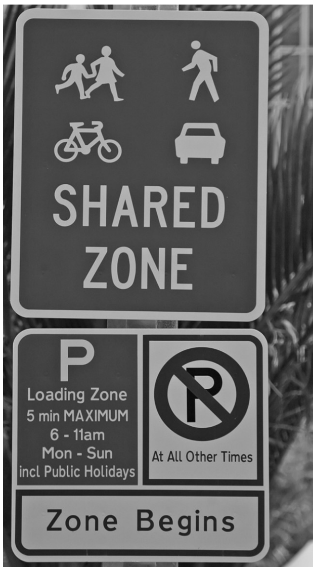
Eine Menge zu lesen am Beginn der Shared Zone...

In dem kurzen Untersuchungszeitraum nach der Fertigstellung der Straßenzüge konnten keine verkehrssicherheitstechnischen Schwachpunkte festgestellt werden. Die bisherigen Daten und Umfragen sprechen dafür, dass die Bewohner von Auckland das Konzept positiv annehmen und mit der Umsetzung nach Shared Space mehr als zufrieden sind. Die Straßen sind nun ein Platz des Aufenthalts mit zahlreichen Cafés, der Einzelhandel boomt und die Stadt besitzt ein neues Viertel zum Flanieren.